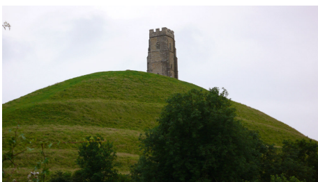
The Tor Glastonbury

Die Wahrheit ist selbstverständlich immer ein Dialog, so dass sich das Handwerkszeug des Heilers immer ändern kann und die Gegensätze der unterschiedlichen Methoden manchmal auch unversöhnlich zu sein scheinen. Gleichzeitig stellen wir aber fest, dass die so allmächtig gewordene Wissenschaft den Betroffenen, Kranken, Patienten oder Verzweifelten auch zum Schamanen oder zur Hexe führt, weil die Konsummedizin trotz ihrer