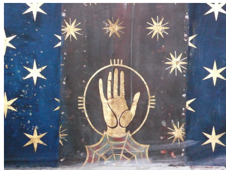
Deckengemälde vor der Madonna in der Krypta in Chartres

Ritualarbeit geht dann auch immer mit Opfer einher (operare, Operation). In der Chirurgie geht dies soweit, dass wir häufig als Menschen und Betroffene tatsächlich Teile unseres Körpers oder ein Organ opfern müssen, um zu gesunden oder gar zu überleben. In der Ritualarbeit des Schamanen oder Druiden sind auch die Hände und Evokationen wichtig.