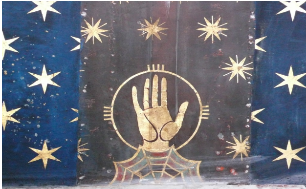
Photo: Die Weltenspinnerin aus der Krypta der schwarzen Madonna der Kathedrale in Chartres

Ritualarbeit geht dann auch immer mit Opfer einher (operare, Operation). In der Chirurgie geht dies soweit, dass wir häufig als Menschen und Betroffene tatsächlich Teile unseres Körpers oder ein Organ opfern müssen, um zu gesunden oder gar zu überleben. In der Ritualarbeit des Schamanen oder Druiden sind auch die Hände und Evokationen wichtig.