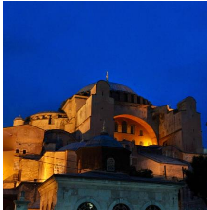
Das Heiligtum „Hagia Sophia“